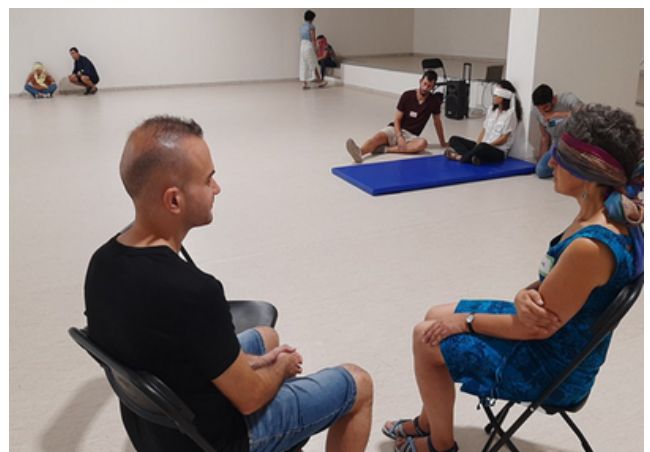
Projecte a l'Institut Angeleta Ferrer de Barcelona